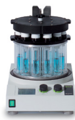
Multivapor™ P-6 / P-12 Эффективное упаривание нескольких образцов