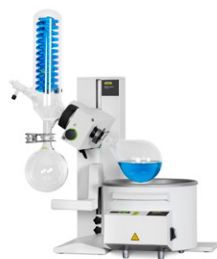
Rotavapor® R-100 Экономичное упаривание