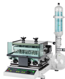
Syncore® Analyst Максимально эффек- тивная обработка нескольких образцов