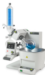
Rotavapor® R-300 Удобное и эффек- тивное ротацион- ное упаривание