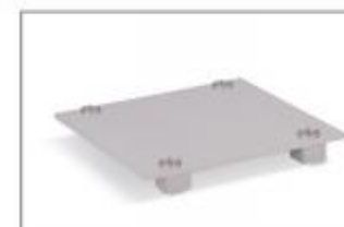
Адаптер для штабелирования