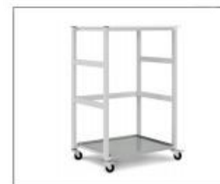
Рамка для штабелирования на роликах