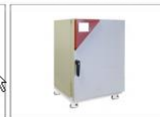
Роликовая подставка с камерой СВ150