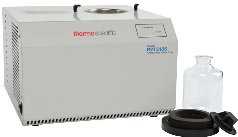
Холодовая ловушка Savant RVT5105, стеклянная колба для конденсата и крышка колбы в разобранном виде