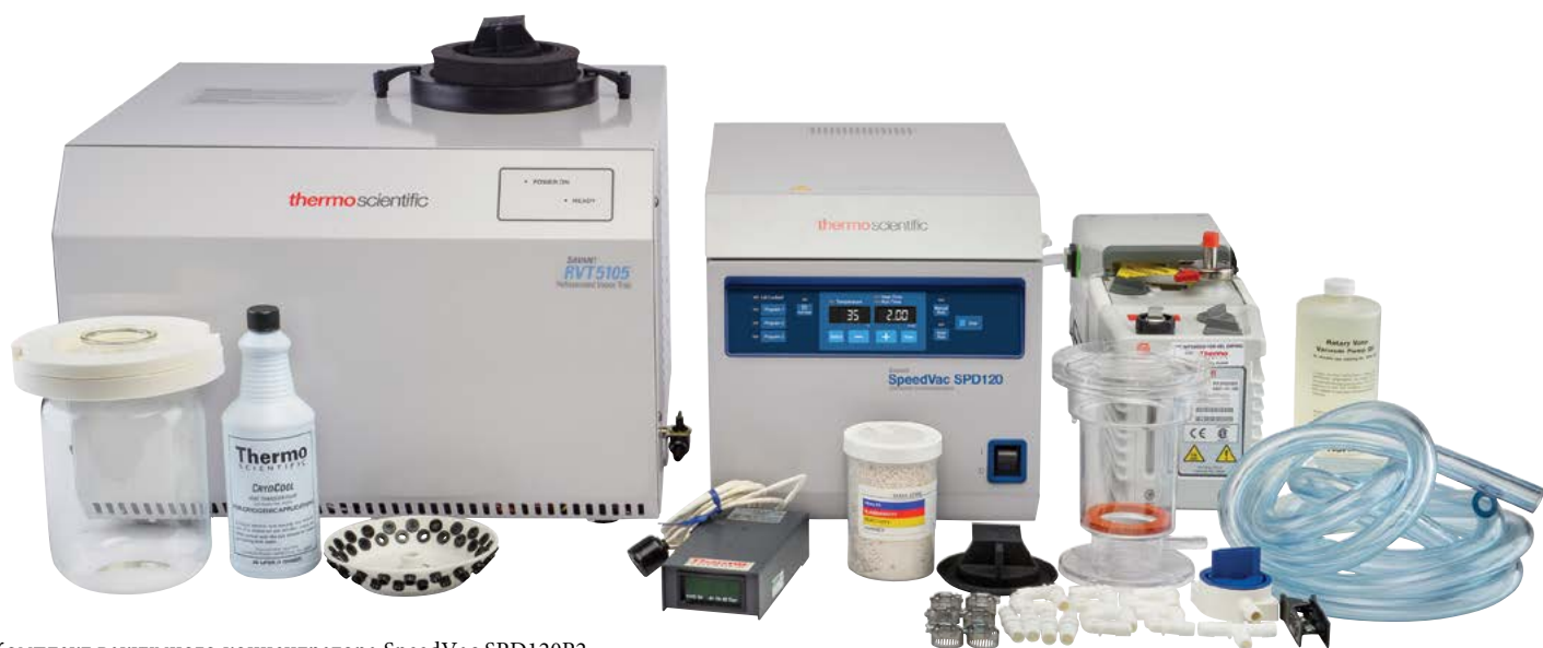
Комплект вакуумного концентратора SpeedVac SPD120P2