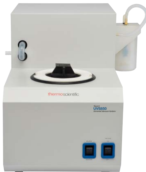
Универсальная вакуумная система Savant UVS850DDA