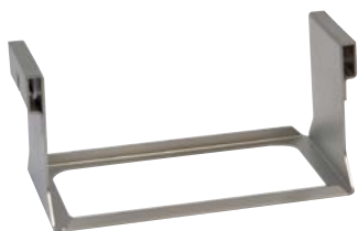
Держатель Savant UPC-1