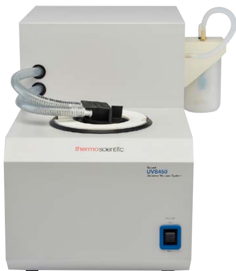
Универсальная вакуумная система Savant UVS450