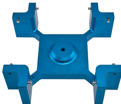
Универсальный планшетный ротор Savant FPR-4A