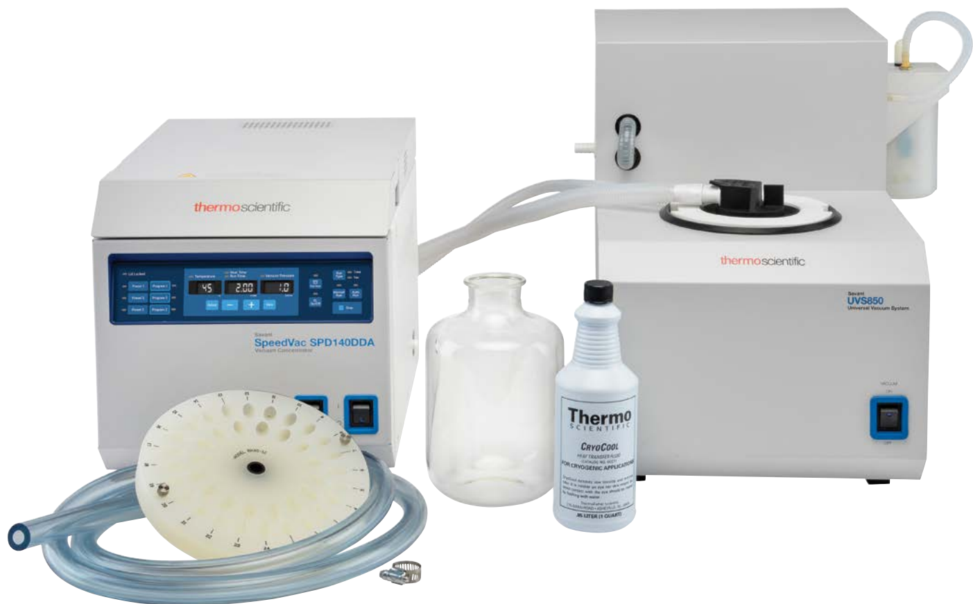
Комплект вакуумного концентратора SpeedVac SPD140P2