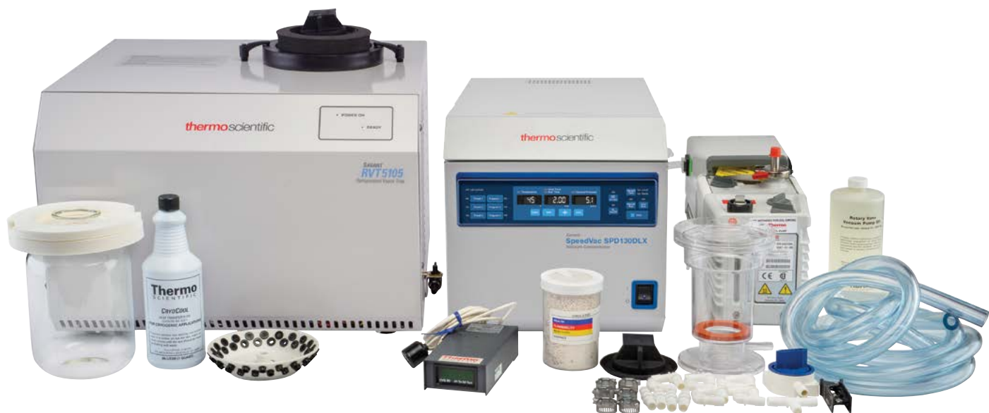
Комплект вакуумного концентратора SpeedVac SPD130P1