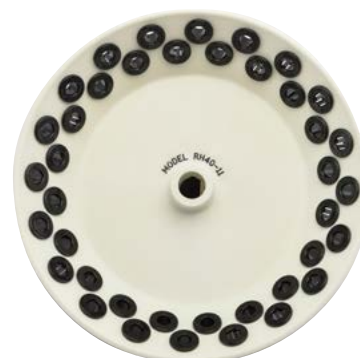
Ротор средней мощности Savant RH40-11