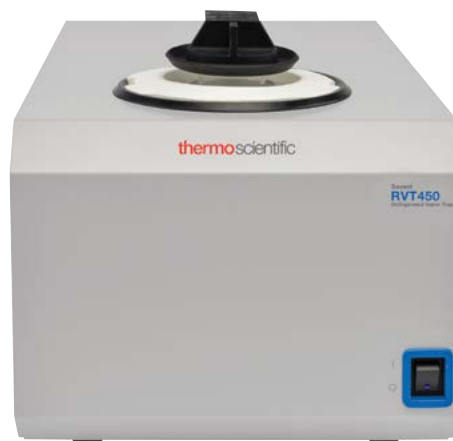
Холодовая ловушка Savant RVT450, стеклянная колба для конденсата и крышка колбы в сборе