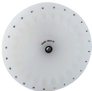
Ротор средней мощности Savant RH24-15

† Может использоваться для обновления комплекта ротора PRO Savant SpeedVac.