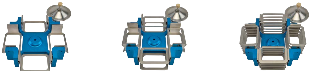
Слева направо: комплекты обновления роторов PRO компании «Термо Сайентифик» PRO-10, PRO-20 и PRO-50