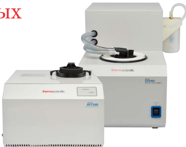
Холодовая ловушка для конденсирующихся паров Savant RVT5105 (спереди) и универсальная вакуумная система Savant UVS450 (сзади)