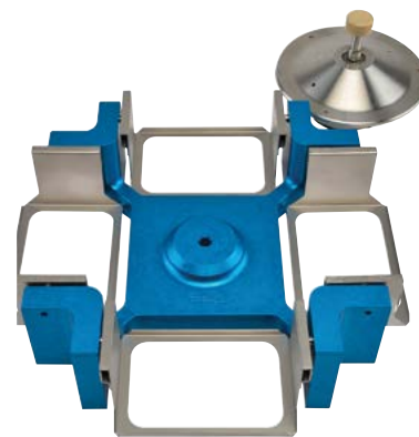
Комплект ротора PRO-10 Savant