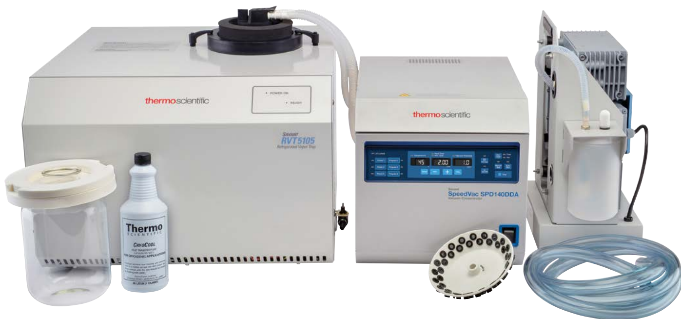
Комплект вакуумного концентратора SpeedVac SPD140P1