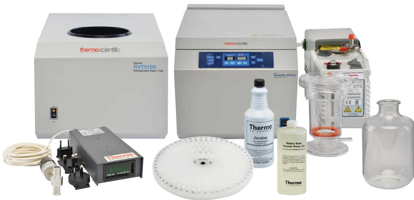
Комплект вакуумного концентратора SpeedVac SPD210P1