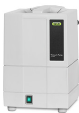
Vacuum Pump V-100 Экономичный источник вакуума