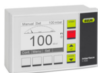
Interface I-100 Экономичное регулирование вакуума