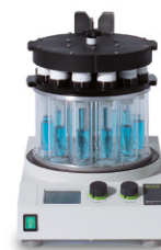
Multivapor™ P-6 / P-12 Эффективное испа- рение нескольких образцов