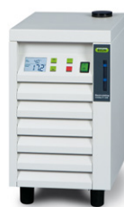
Recirculating Chiller F-100 / F-105 Самый легкий способ охлаждения